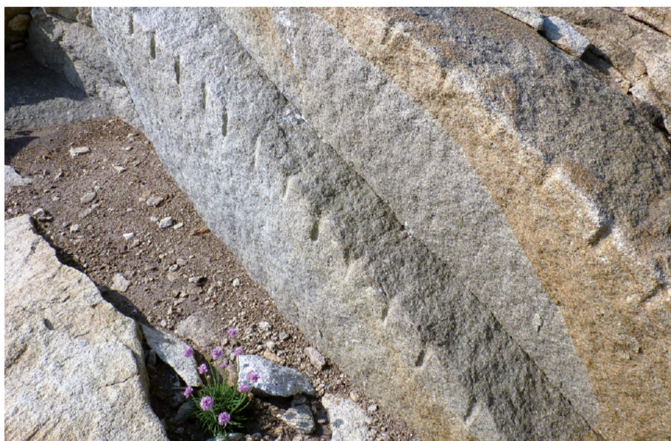
Traces de carrier.