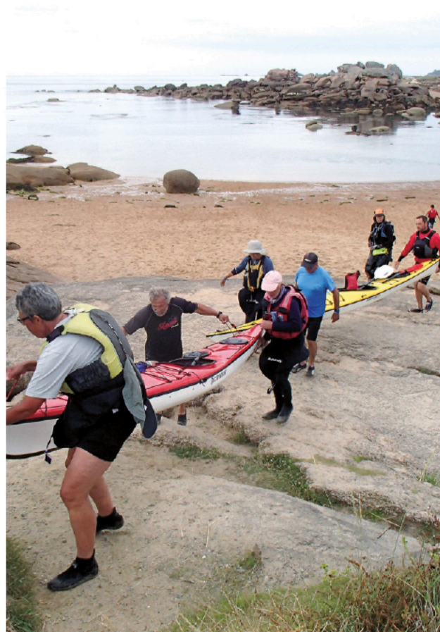
Portage à l'île Renote.

P artez de l'île Renote à marée haute. Ainsi, vous pourrez profiter de nombreux petits passages entre les roches et les bancs de galets et explorer quelques lieux inaccessibles à marée basse. La plage de sable rose orangé de l'île Renote donne le ton du début de l'itinéraire : vous allez savourer une autre portion de la côte de Granit rose aux roches de formes si étranges. Contournez la pointe de Beg ar Vir en allant un peu au large saluer l'énorme roche du Dé . Vous apercevez la cale du Forum, tout près d'une série de roches imposantes. Passez devant ce complexe thermal d'eau de mer, dont la construction fut très controversée. Après le cap suivant, voici, dominée par le rocher du Roi Gradlon, la Grève Blanche et ses amusantes cabines de plage. La partie ouest de la grève a subi une tempête dévastatrice qui a fait reculer le profil de la plage de quelques mètres. Un tombolo relie plus haut que mi-marée la Grève Blanche à l'île aux Lapins :