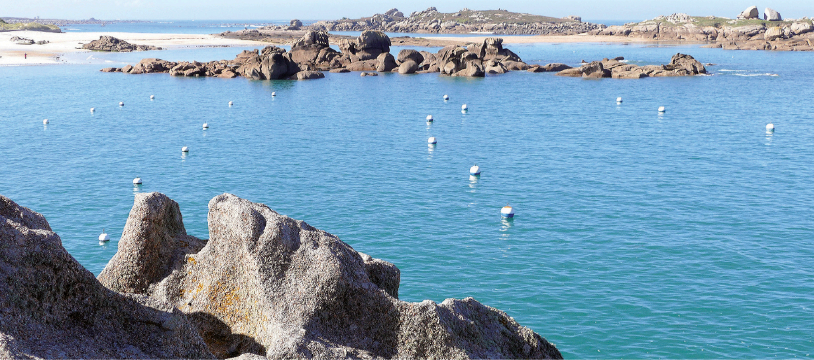
Île de Seigle.

passerez-vous à temps ? La belle île de Seigle est segmentée en trois parties à marée haute. L'érosion donne là aussi au granit des formes étranges où plissements et torsades se succèdent en festival. Plus au sud, proche de l'embouchure d'un ruisseau, l' île Tanguy fait contraste : elle est porteuse d'un jardin d'arbres et d'herbes. Elle exalte le végétal et marque la fin de ce festival minéral. La côte elle-même est changée ; plus