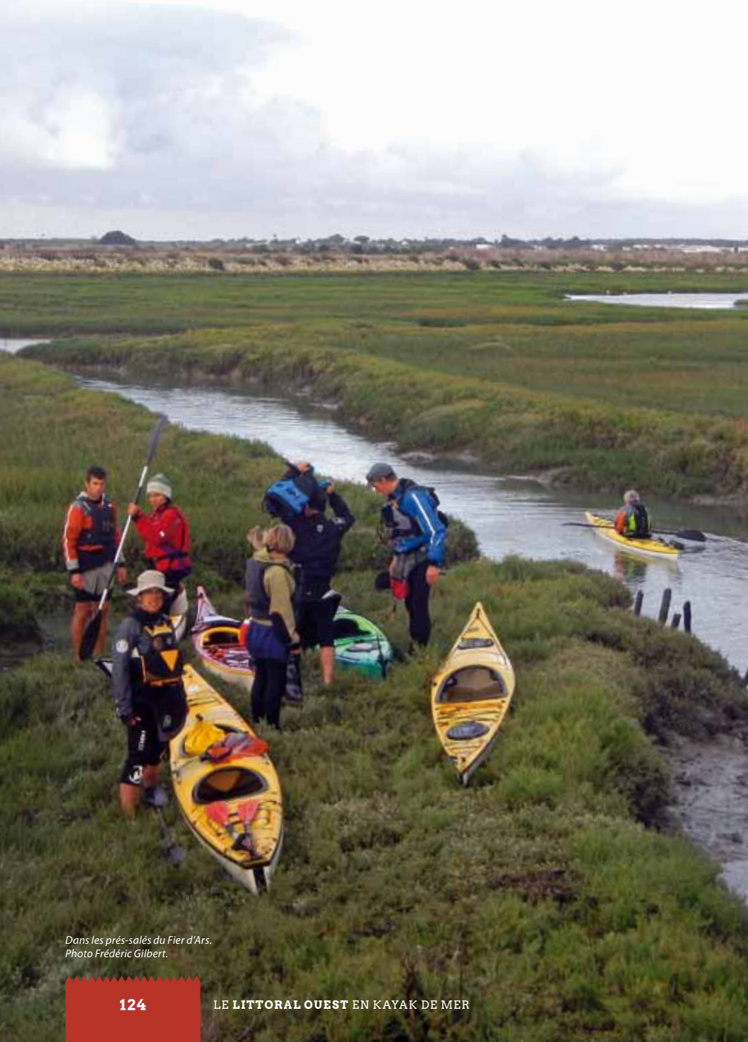
Dans les prés-salés du Fier d'Ars.