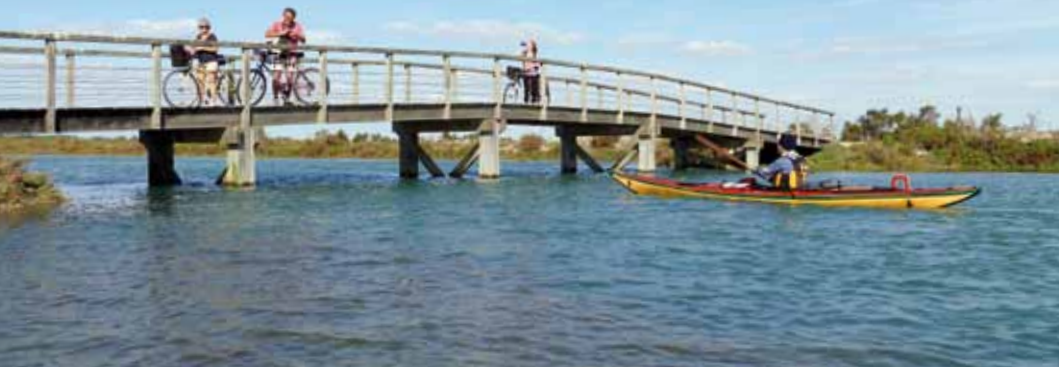
Chenal des Villages, rencontre entre randonneurs.

longe. Les digues de béton cèdent la place aux levées ou « bosses » des anciens marais salants sur lesquelles, autrefois, on semait des céréales. Passez sous une passerelle à