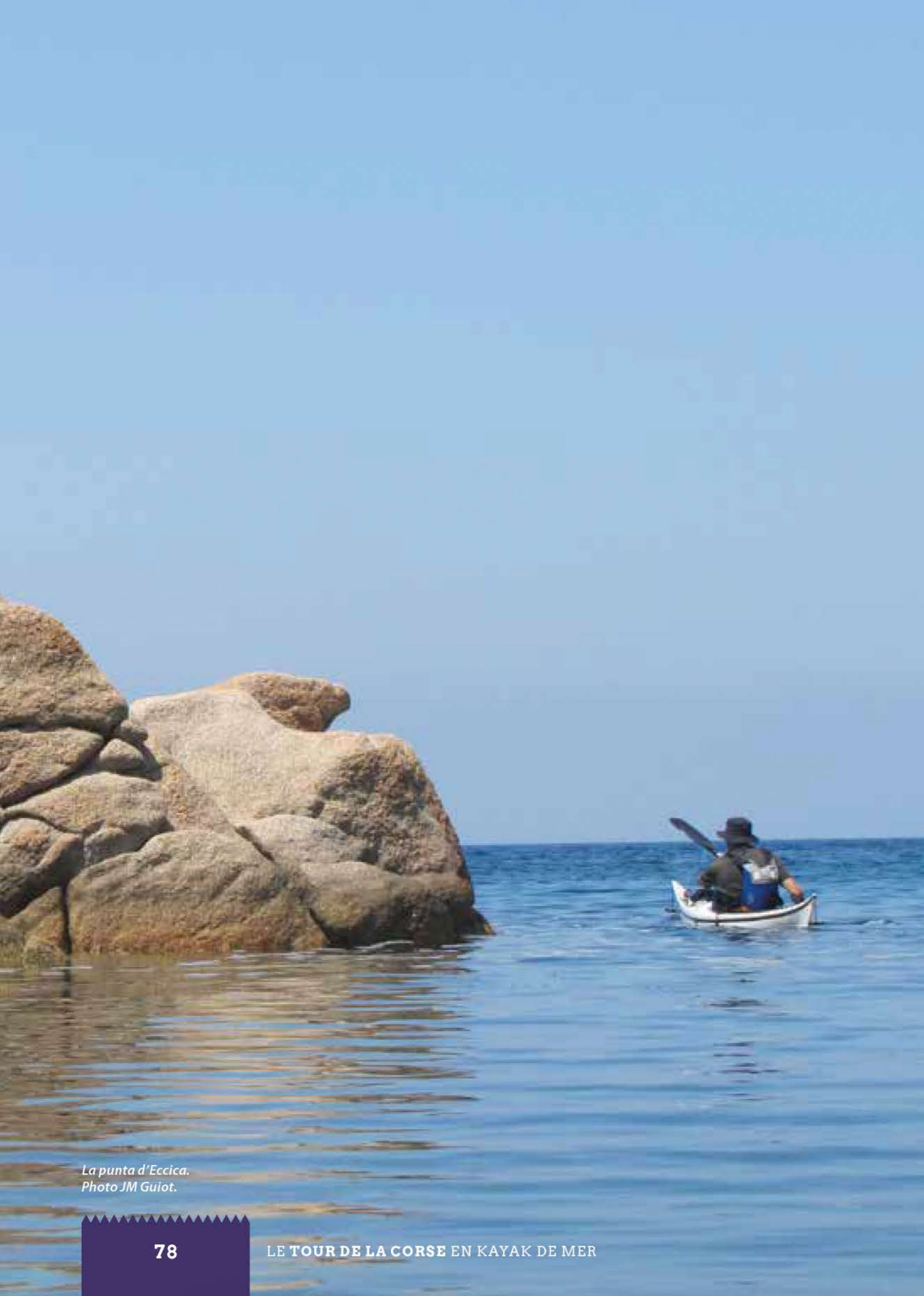
La punta d'Eccica.