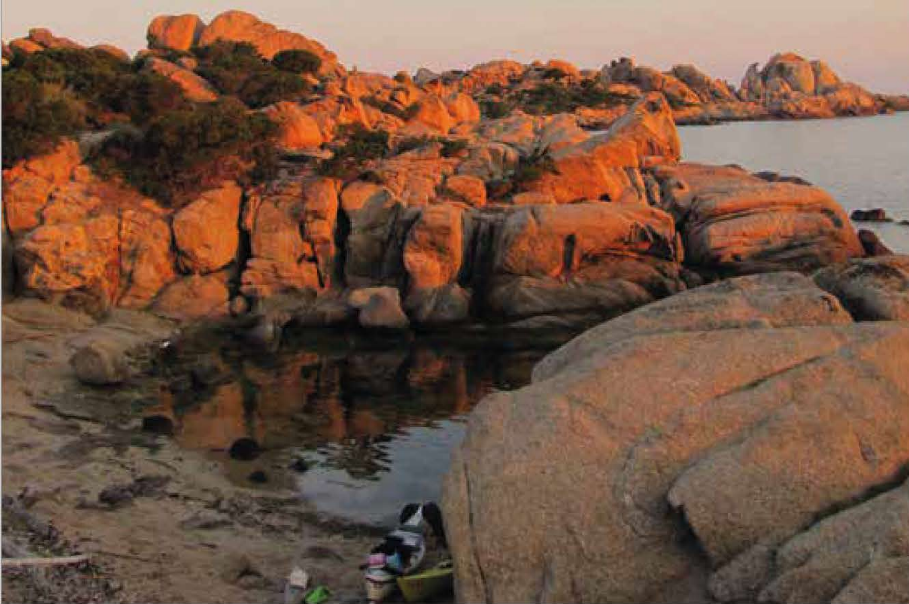
À la pointe de Senetosa.

Entre Tizzano et Senetosa, une dizaine de très belles calanques se succèdent, offrant des possibilités d'accostage et de baignade. Sous le phare de Senetosa, entre les pointes de l'Aquila et de l'Ilusetta, où un merveilleux rase-cailloux s'offre à vous, plusieurs petites criques permettent d'accoster. Profitez-en pour remonter le sentier qui mène au phare. Celui-ci, mérite une visite. Construit en 1890, c'est le dernier phare de Corse à avoir été construit. Il se démarque de l'architecture traditionnelle car il est composé de deux tourelles entourant le bâtiment technique et les logements des gardiens. L'une porte un feu à éclat rouge, l'autre à éclat blanc. Sa construction, nécessaire pour marquer l'entrée des Bouches de Bonifaccio et les écueils des Moines et de Latoniccia, fut longtemps repoussée du fait de son éloignement. De ce fait, son ravitaillement se faisait par bateau depuis Ajaccio plutôt que par la terre jusqu'à son automatisation en 1988. L'ancienne cale est encore visible.