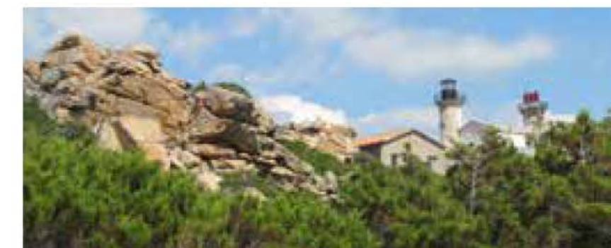
Phare de Senetosa.

Le littoral est essentiellement rocheux mais de nombreuses criques permettent d'accoster à intervalles réguliers. La partie qui précède l'arrivée à Campomoro est en revanche difficilement accessible. Le sémaphore le plus proche est celui de La Parata.